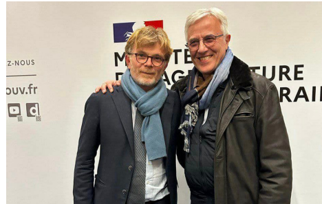
Marc Fesneau, Ministre de l'Agriculture