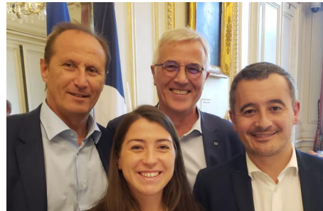
Gérald Darmanin, Ministre de l'Intérieur