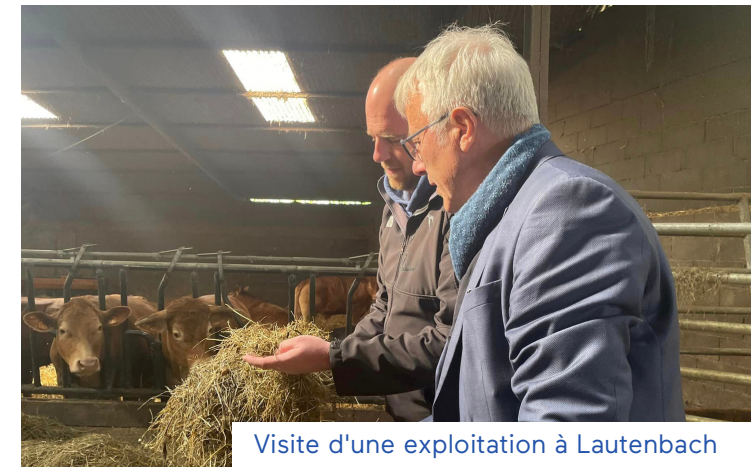
Visite d'une exploitation à Lautenbach

Durant les mois d'avril et de mai, j'ai donc rencontré les différents acteurs locaux des filières agricoles, tout en continuant à aller à la rencontre de nos agriculteurs sur le terrain .