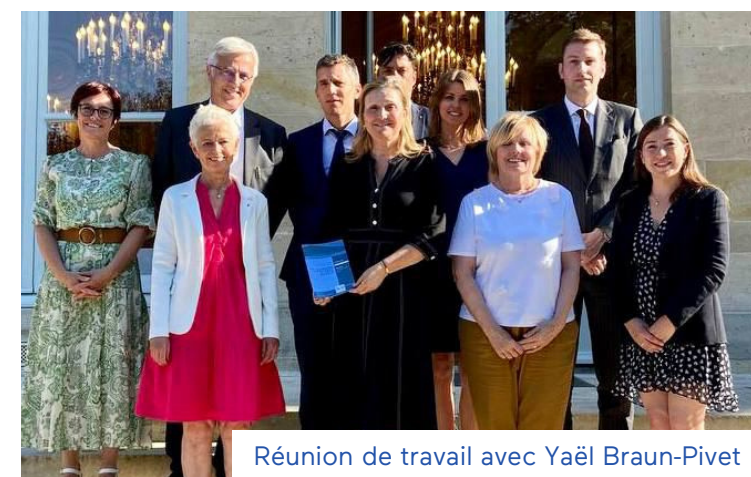
Réunion de travail avec Yaël Braun-Pivet

L'Alsace est une terre marquée par une grande histoire industrielle qui, au fil des décennies, a façonné notre territoire. J'ai donc interrogé le ministre délégué chargé de l'Industrie sur le localisme et la réindustrialisation de notre pays en m'appuyant sur l'exemple de la filière textile qui caractérise notre territoire. Plus que jamais, nous devons rapprocher la production de la consommation pour à la fois créer de l'emploi localement mais aussi répondre aux enjeux du développement durable . Si nous voulons réussir nos transitions, il faut repenser nos manières de produire et nos réseaux d'approvisionnement. Cette ambition de filières françaises fortes est un impératif qui me tient particulièrement à cœur et qui permettra à notre territoire de maintenir son attractivité.