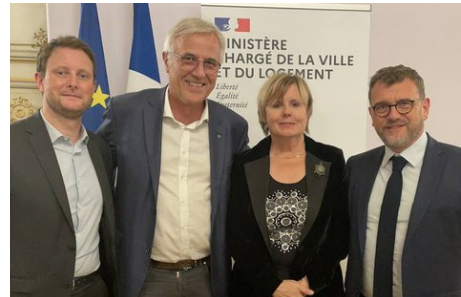
Clément Beaune, Ministre des Transports